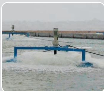
Umwelttechnik- Abwasserbehandlung: Belüfterantriebe