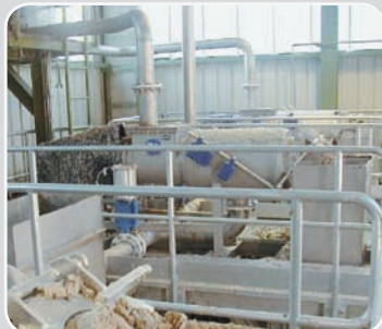
Umwelttechnik- Feststofftrennung: Antriebe für Separatoren